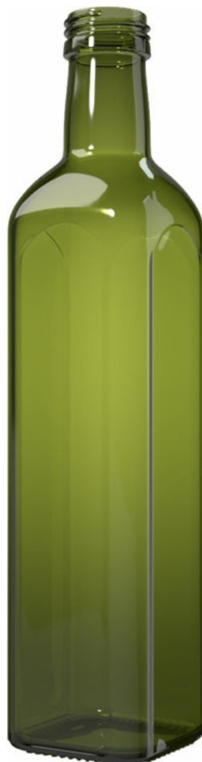
UV GREEN N72004898