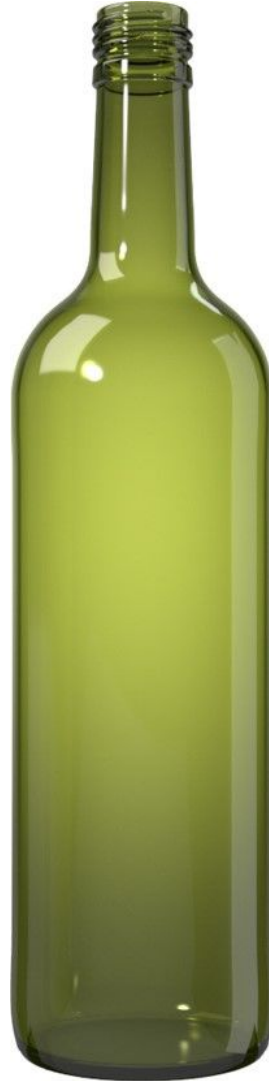
UV GREEN N72205008