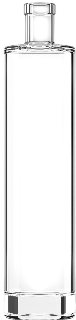
FLINT - EXTRA 300