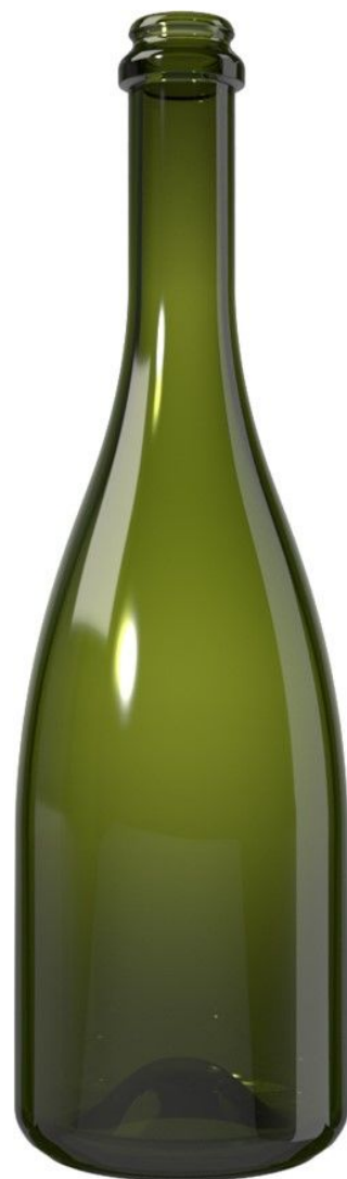
VERDE UV N72200881