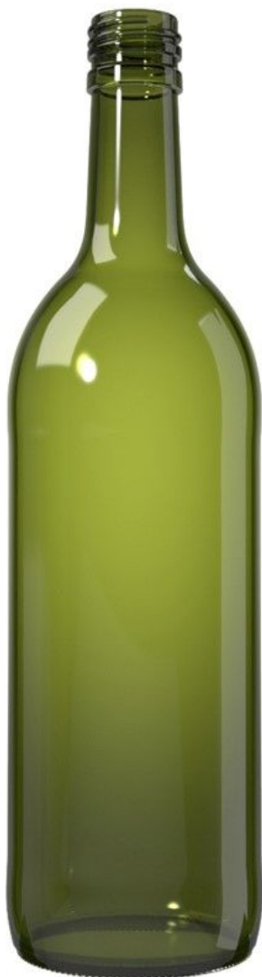
VERDE UV N72202369