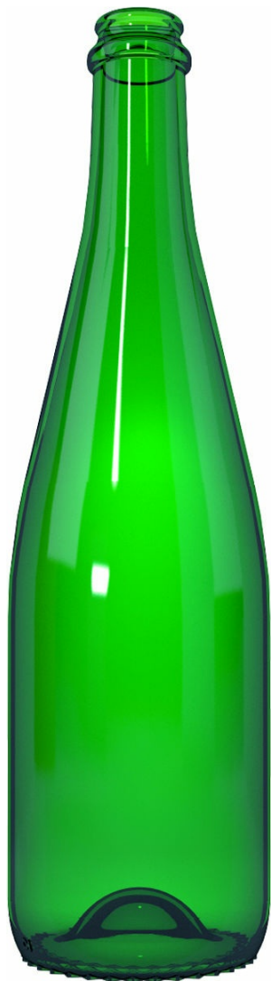
EMERALD GREEN B70