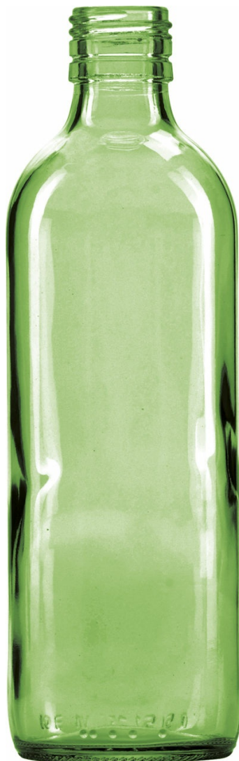
BIRRA VERDE SMERALDO