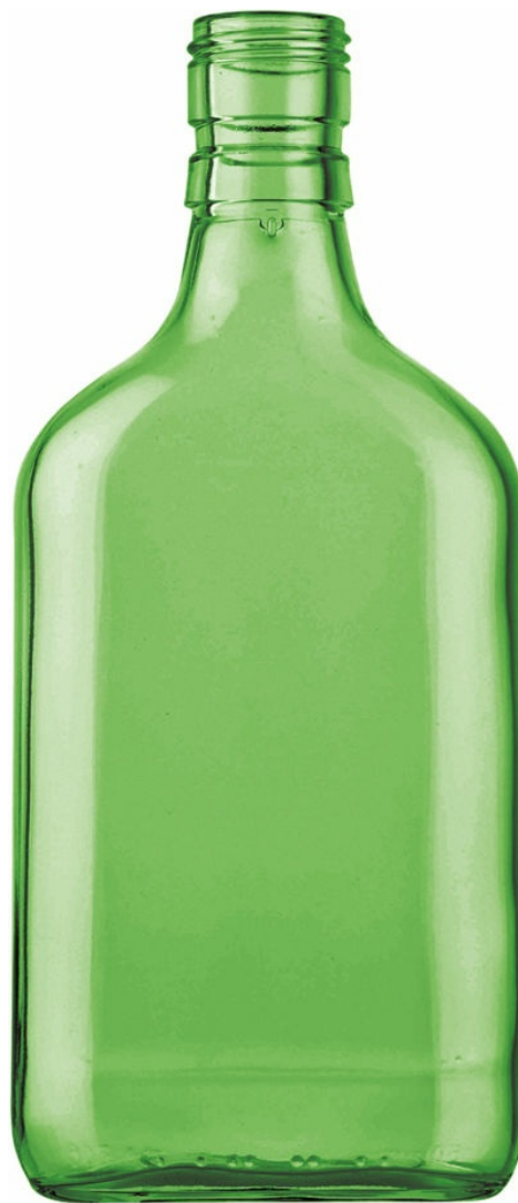
VERT STANDARD G5001209