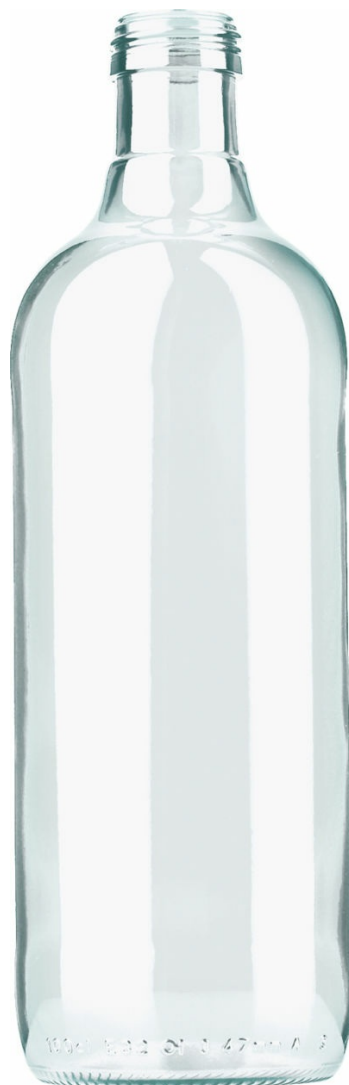
SEMI FLINT F2008220