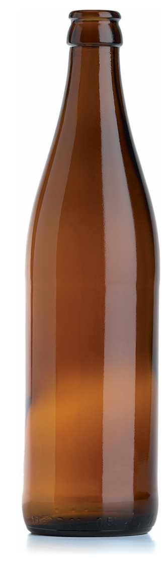
BIRRA AMBRATA A1016062