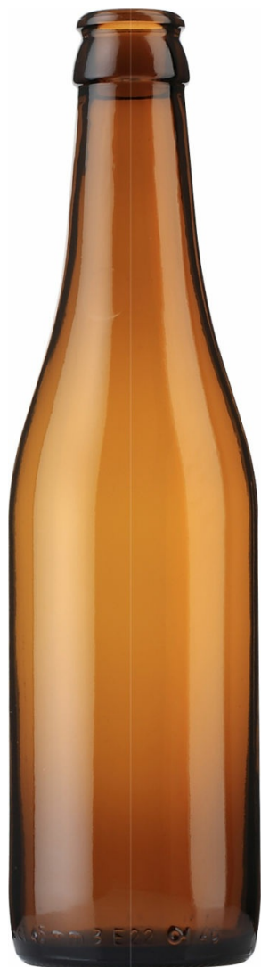
ÁMBAR PARA CERVEZA