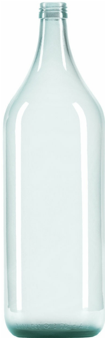
SEMI BLANCO F2007521