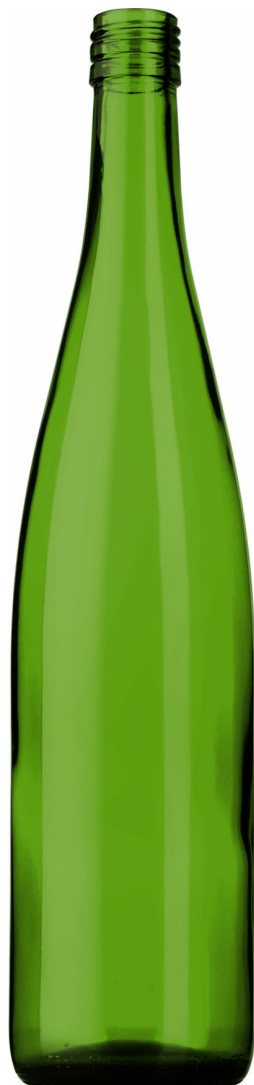
VERDE PARA CHAMPÁN