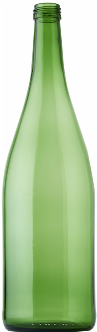
VERDE ESMERALDA PARA CERVEZA