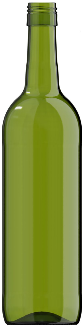
VERDE PARA CHAMPÁN