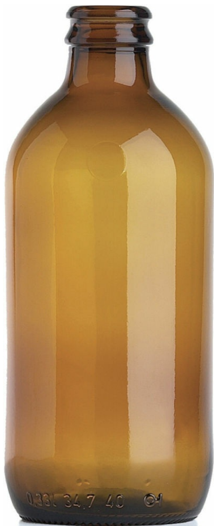
ÁMBAR PARA CERVEZA