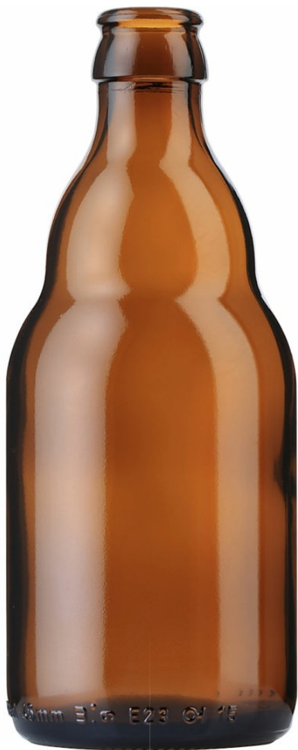
ÁMBAR PARA CERVEZA