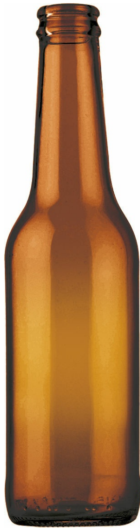
ÁMBAR ROJO A3005171