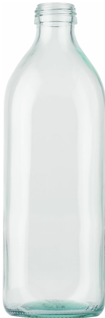
SEMI BLANCO F2007464