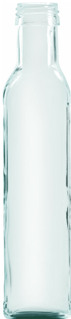
SEMI BLANCO F2008108