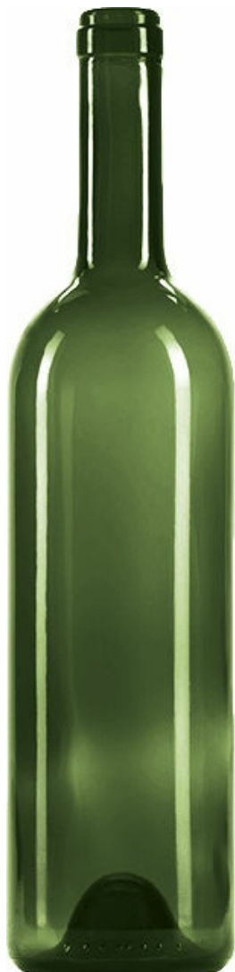
VERDE PARA CHAMPÁN G6019171