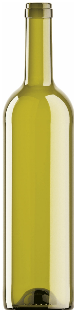
HOJA MUERTA L1110045