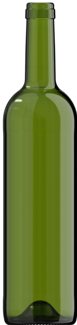
VERDE PARA CHAMPÁN