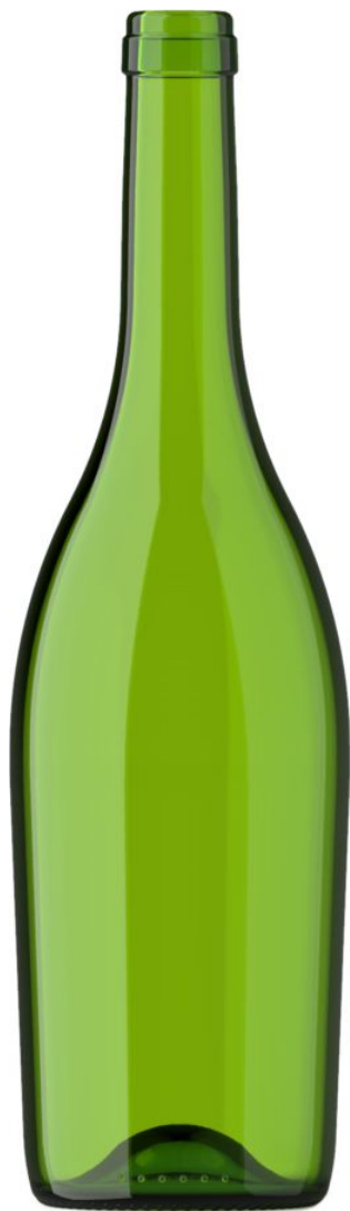
VERDE PARA CHAMPÁN