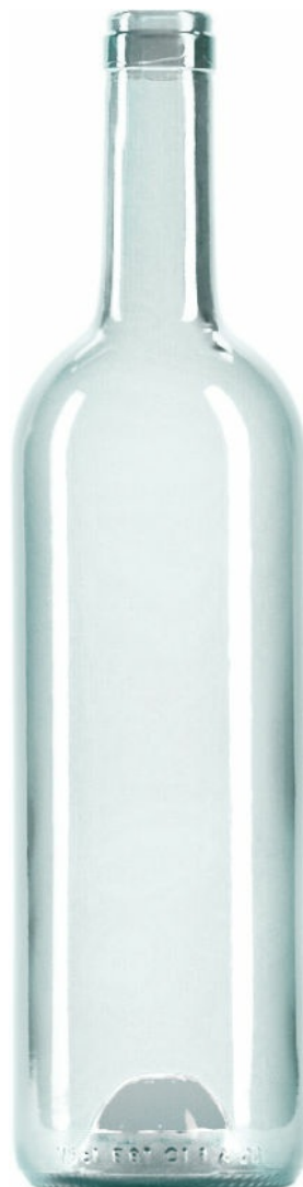
SEMI FLINT F2007305