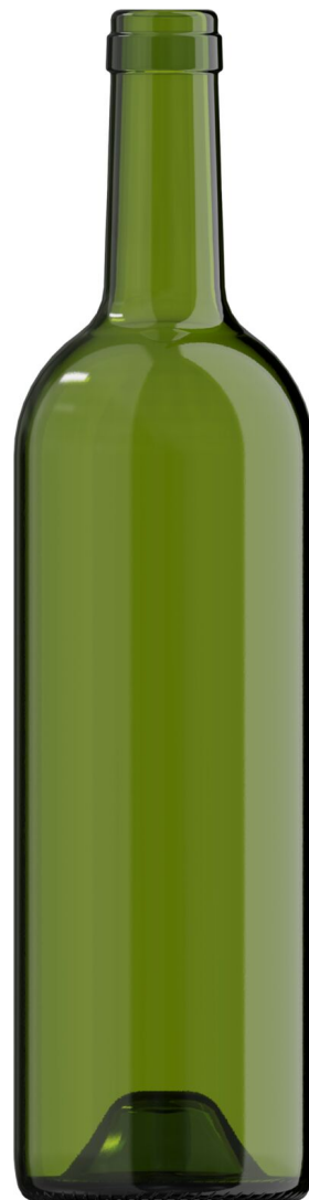
VERDE CHAMPAGNE G6200233