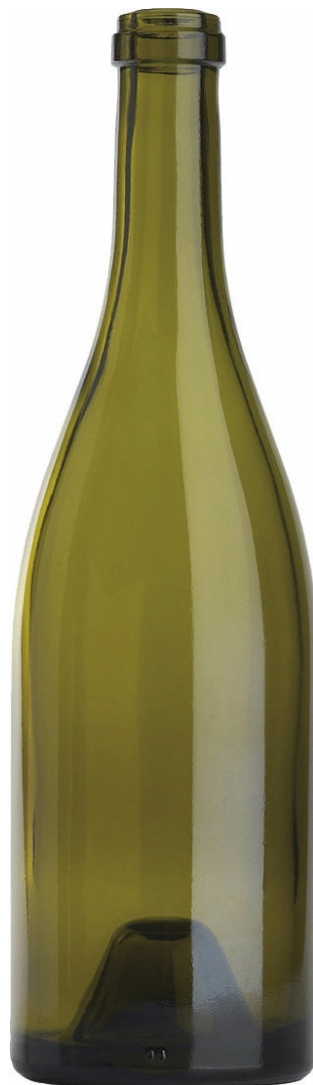
HOJA MUERTA L1012195