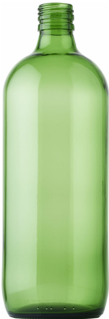
VERDE ESMERALDA PARA CERVEZA