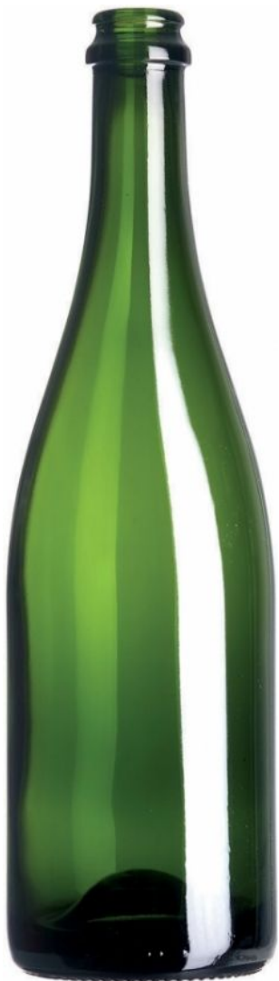
VERDE PARA CHAMPÁN