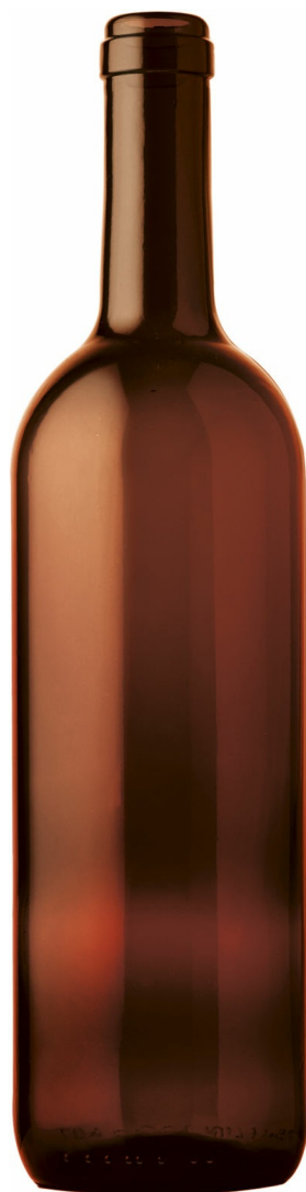
AMBRE FONCÉ A2110186