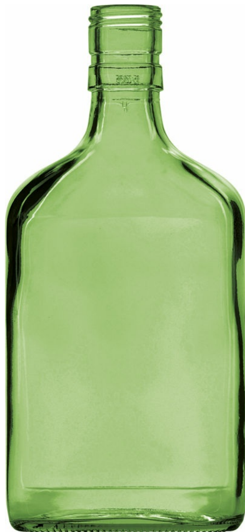
VERDE STANDARD G5001147