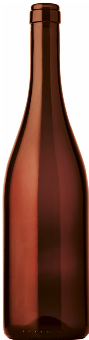
AMBRATO SCURO A2007328