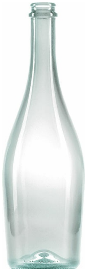
SEMI FLINT F2110385