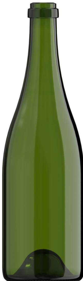
VERDE PARA CHAMPÁN