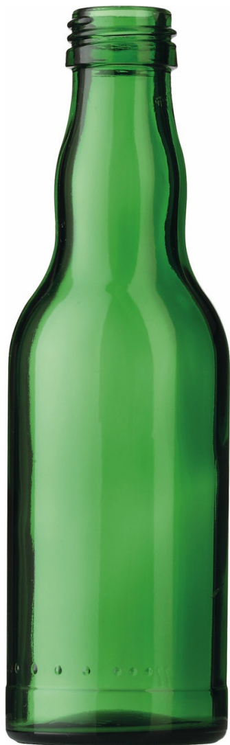
BIÈRE VERT ÉMERAUDE