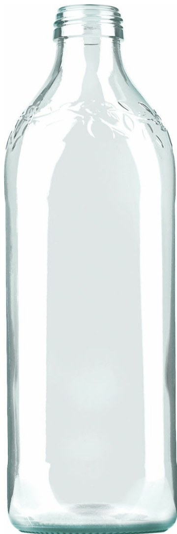
SEMI BLANCO F2007466