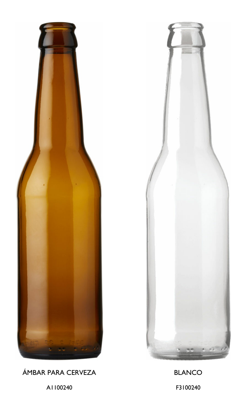
33CL JW I