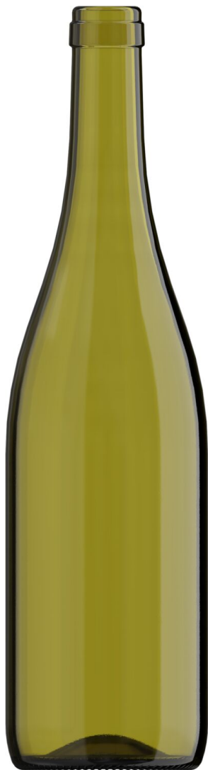
HOJA MUERTA L1230647