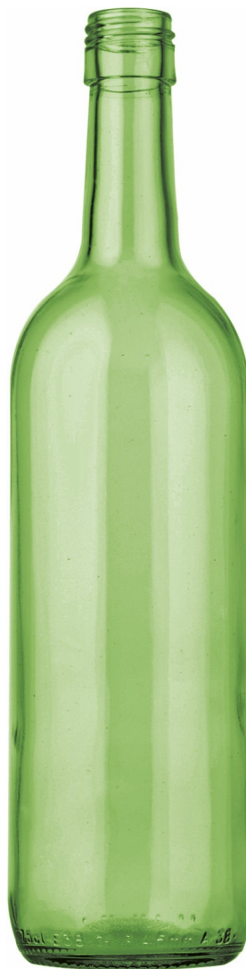
BIRRA VERDE SMERALDO G3110325