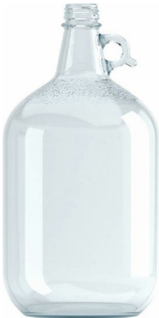
FLINT - INDUSTRIAL 1200