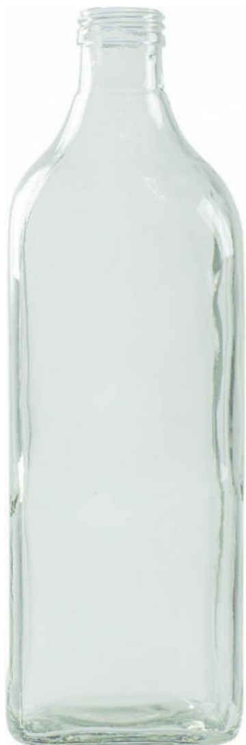
FLINT - INDUSTRIAL 1200