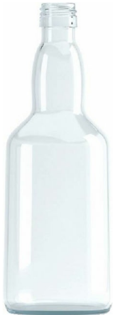
FLINT - INDUSTRIAL 1200