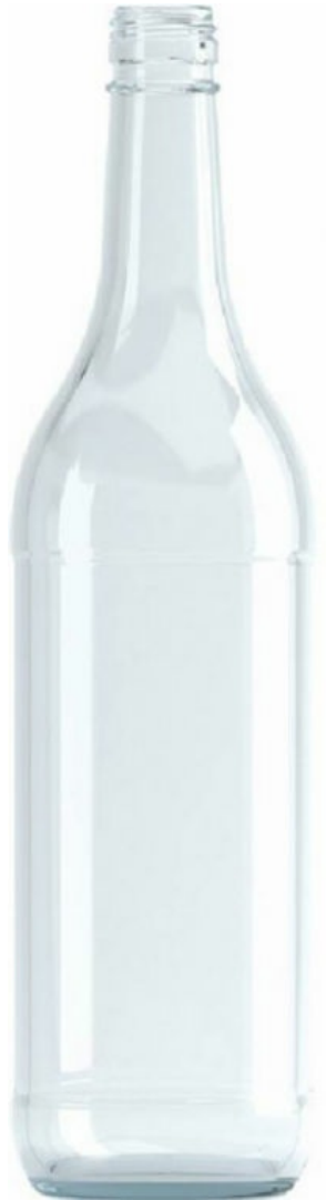
FLINT - INDUSTRIAL 1200