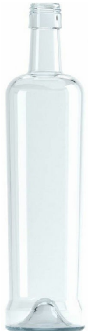
FLINT - INDUSTRIAL I200