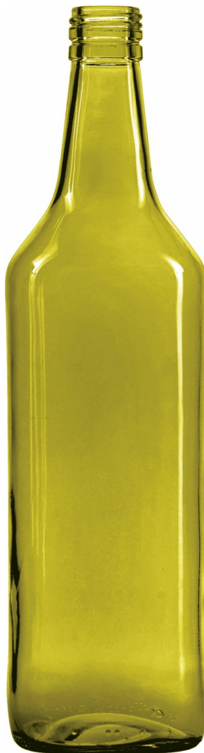
HOJA MUERTA LI012633